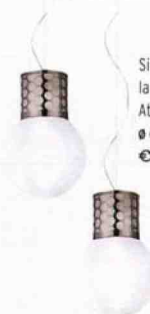
Singola o in coppia la LAMPADA Atmosfera [Slamp, ø cm 30x44,5 € 290 cadauna].