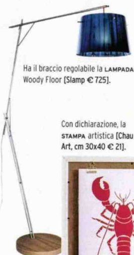
Ha il braccio regolabile la LAMPADA Woody Floor [Slamp € 725].