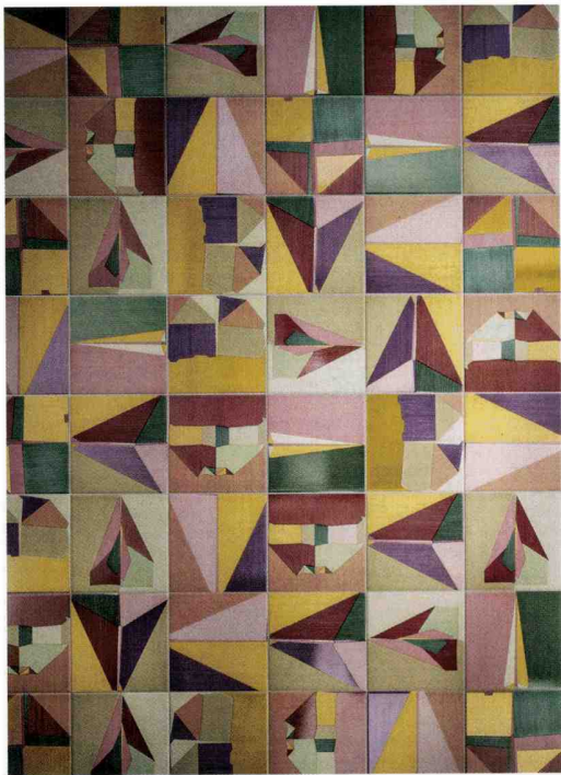
Corrispondenza di Dimorestudio: un disegno geometrico sofisticato in sette varianti, decorato a mano sulle piastrelle utilizzando la tecnica dello stencil.